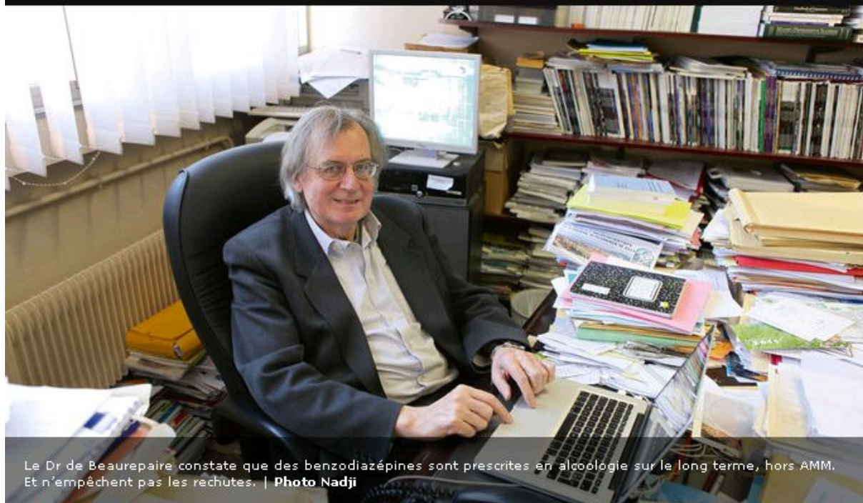
Le Dr de Beaurepaire constate que des benzodiazépines sont prescrites en alcoologie sur le long terme, hors AMM. Et n'empêchent pas les rechutes.